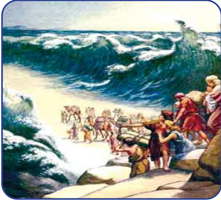
(انشقاق البحر وعبورُ سيدنا موسى (ع) ومن آمن معه ونجاتهم)