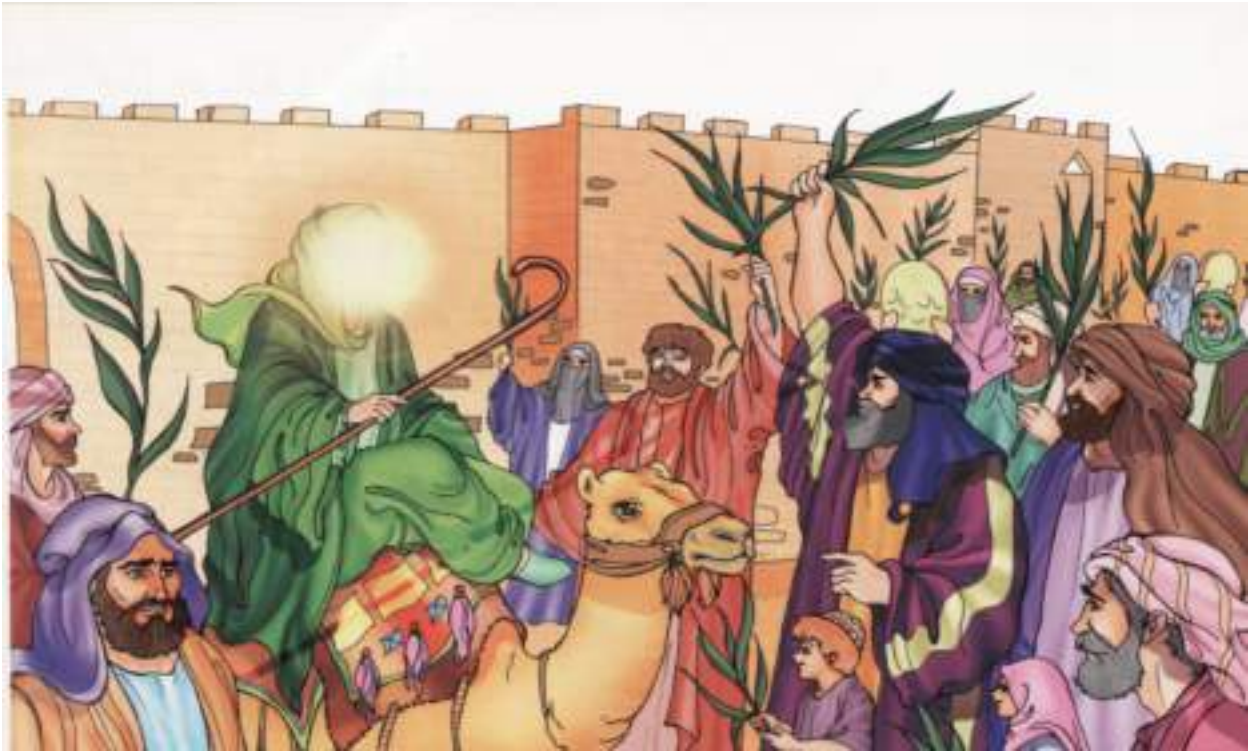
اهل يثرب (المدينة المنورة) يستقبلون رسول الله (ص)

طلَعَ البدرُ علينا من ثنَيَاتِ الوداعِ وجبَ الشكرُ علينا ما دعا لله داعِ أيُّها المبعوثُ فينا جنّت بالأمر المطاعِ جنّت شرفّت المدينة مرحباً يا خير داعِ