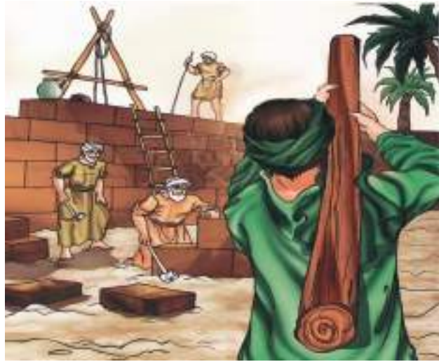
المسلمون يشيّدون المسجد النبوي معهم رسول الله (ص)

بعد أن وصل النبي (ص) إلى المدينة قدّم له المسلمون فيها المساعدةً وتعاونوا معه ودافعوا عنه، وقام رسول الله محمدٌ (ص) هو وأصحابه ببناء مسجد المدينة من الطين وجذوع النخيل وسعفها، وكان النبي (ص) يعمل معهم في البناء.. فكمّل البناء.. وقد جعل رسول الله طولَ المسجد سبعين ذراعاً وعرضه ستين ذراعاً عندما بناه أول مرة، وبعد مدة من الزمان وسّع الرسول (ص) بناء المسجد فجعل طوله مئة ذراع وعرضه مئة ذراع. وأخذ النبي (ص) والمسلمون يقيمون الصلاةً ويجتمعون فيه.. والرسول يعلمهم القرآن والأخلاق الإسلامية الفاضلة وتعاليم الدين.. والمسلمون مجتمعون حوله يحبّ بعضهم بعضاً، ويتعاونون فيما بينهم، ويقدم الأغنياء المساعدة المالية، وهي الزكاة للفقراء..